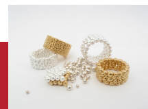
Au - Ag Verbindung