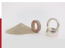
Au - Ag Verbindung