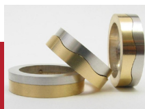
Pt - Au Verbindung