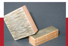
Ag - Cu Verbindung