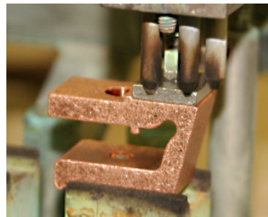
Ag - Cu Verbindung