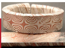
Ag - Cu Verbindung